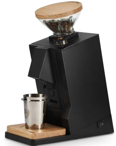
Nero Opaco & Rovere · Matt Black & Walnut