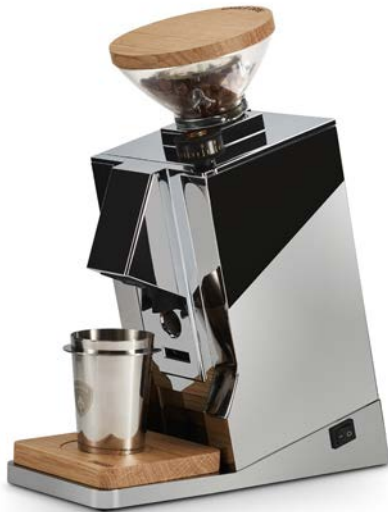
Cromato & Rovere · Chrome & Walnut