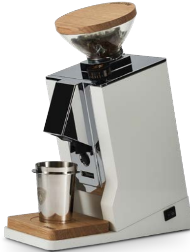
Bianco & Rovere · White & Walnut